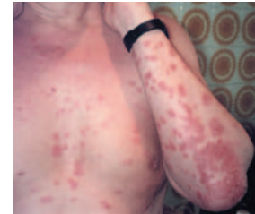
Die beiden Fotos zeigen die Behandlungsergebnisse bei Schuppenflechte mit Silberdos Kolloidal.

• Man trinkt es unverdünnt. • Es ist wichtig, dass man die Flüssigkeit nicht sofort hinter schluckt, sondern zuerst